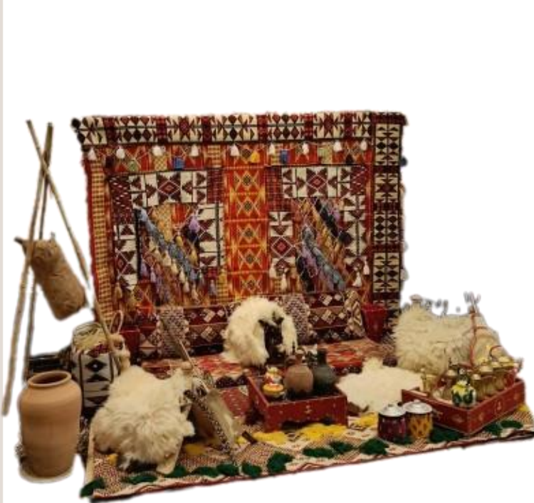
(صورة من عمل سابق لشركة اكسبولا)